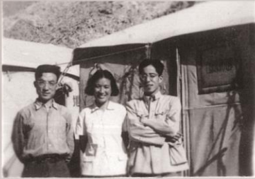
1953年，地质部641物探分队部分职工在白银厂铜矿区野外工作拍摄。