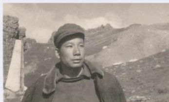
1967年，青海省果洛藏族自治州钻机施工地点海拔超过5000米。