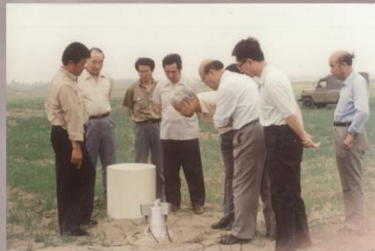
1993年7月3日，河北省固安永定河中国勘查技术组织对当时物化探所与北京大学共同承担的地矿部重点科研项目“地质应用超导磁力仪”野外实验现场情况。