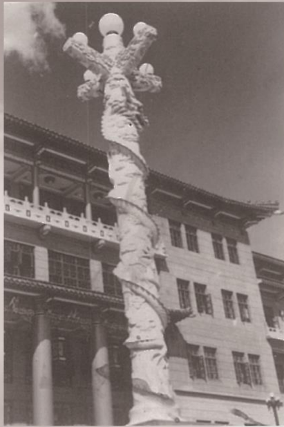
1952年全国高校进行院系调整后，将部分东北工学院和山东大学地质系部分师生加上新生，于1952年建立了东北地质学院，图为1952年东北地质学院建筑——华表。