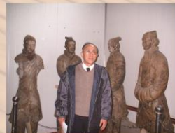
2003年在秦始皇陵地宫勘查项目实施中，在文官坑。