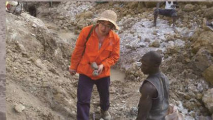
2013年在尼日利亚铂铑矿野外考察