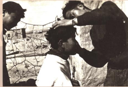
1960上半年青海柴达木冷湖油田，冷湖这个地方，没有湖水，只有茫茫戈壁、浩瀚沙漠，为同学理发。