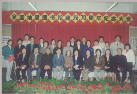
1992年9月22日全国地质图书馆建馆70周年纪念大会