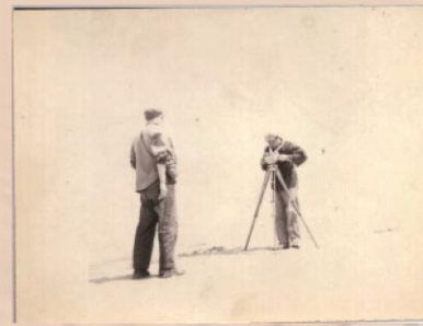
1961年在北京密云水库北侧进行生产实习（磁法找铁）。