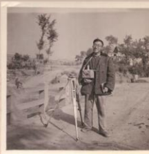
1961年在北京密云水库北侧进行生产实习（磁法找铁）