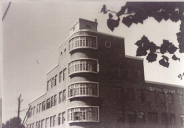
1952年全国高校进行院系调整后，将部分东北工学院和山东大学地质系部分师生加上新生，于1952年建立了东北地质学院，图为校本部。