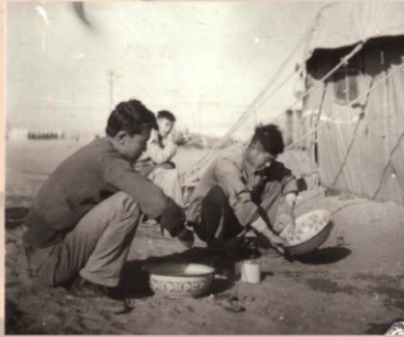
1960上半年青海柴达木冷湖油田，冷湖这个地方，没有湖水，只有茫茫戈壁、浩瀚沙漠，用砂子洗验盆。