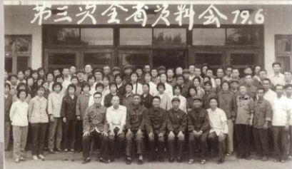
1979年6月, 辽宁省地质局第三次全省资料会。