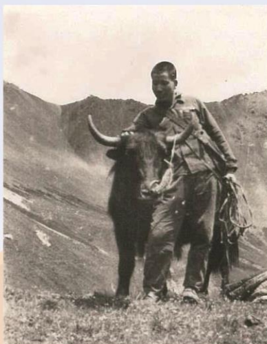
1967年，在青海省果洛藏族自治州，40多年前德尔尼矿区野外工作时的交通工具。