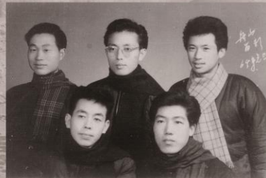
1964年浙江省物探大队在舟山寻找地下水。照片中人分别是几个2区技术员; 前左一为分队技术负责。