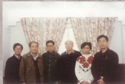
1987年中国地质矿产信息研究院综合处同志们合影留念