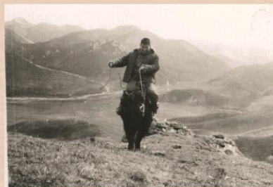
1967年，青海省果洛藏族自治州，40多年前德尔尼矿区野外工作时的交通工具，牦牛是野外交通工具。