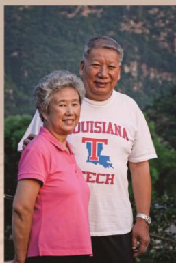
地质郎有这样的媳妇陪伴，就是走遍千山万水，心里也总是幸福温暖的。