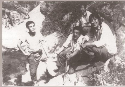
1975年 陕西眉县铜矿区野外实习