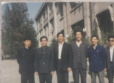
老情报所人员合影