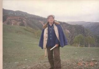
2014年8月参与特殊地区地质填图项目野外质量检查（黑龙江）