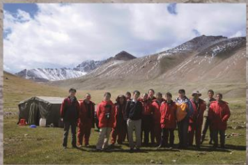
北京公司在天山深处地质勘查