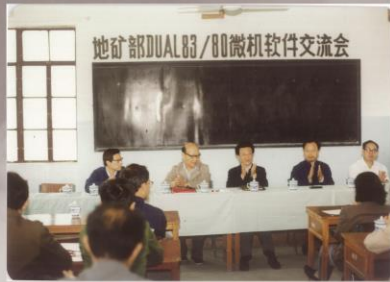
1986年6月10日，地矿部第一物探大队在DUAL83/80微型计算机上进行推广应用交流会。