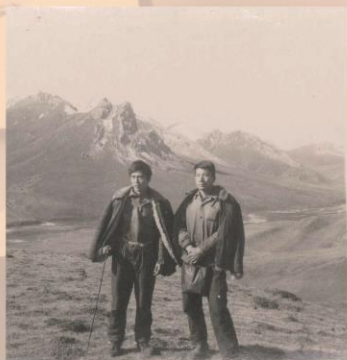
1967年，青海省果洛藏族自治州40多年前德尔尼矿区的标志性地貌奶头峰。