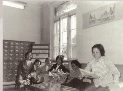
全国地质图书馆借阅工作人员合影