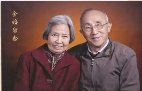
回想我这一辈子，专心从事地质工作五十七年……为国家地质工作做出了一定的贡献，但却亏欠家人太多太多。