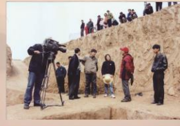
2003年在秦始皇陵地宫勘查项目实施现场