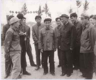
1963年地质矿产部党组书记何长工来位于北京大兴区凤河营京津区队钻井队检查工作现场。