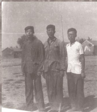
1960年在山东省临沂郯城地区从事磁法普查，也叫生产实习。