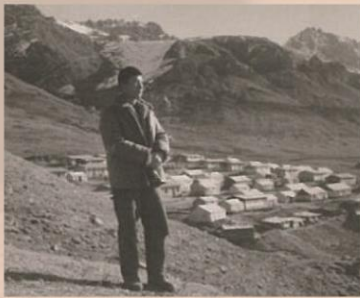
1967年青海省果洛藏族自治州，德尔尼铜矿区进行地质勘探，背后是海拔4200米的大队部。