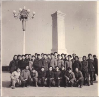
1958年9月，初入北京地质学院，61582班全体在天安门合影。