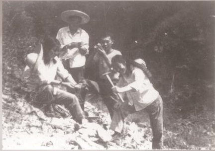
1972年8月北戴河野外实习