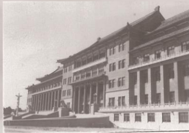
1952年，东北地质学院教学楼外景。