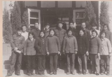
1959年参加“前苏联孢子粉专家培训班”部分学员合影