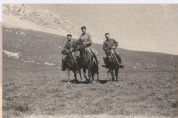
1967年，青海省果洛藏族自治州，40多年前德尔尼矿区野外工作时的交通工具，马匹是野外交通工具。