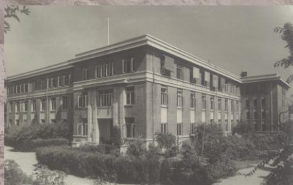
现地调局大楼原址（原地科院情报所）