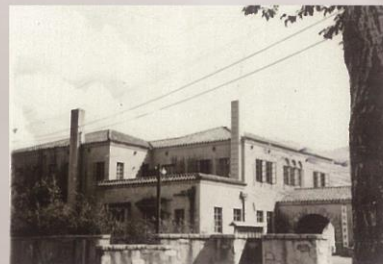
1952年全国高校进行院系调整后，将部分东北工学院和山东大学地质系部分师生加上新生，于1952年建立了东北地质学院，图为学生宿舍。