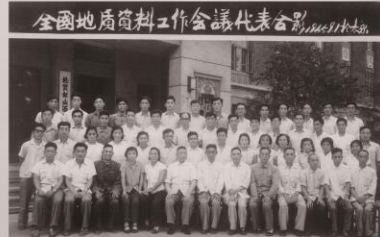
1965年9月1日全国地质资料工作会议代表在太原合影。