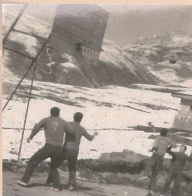
1967年，青海省果洛藏族自治州，队部的篮球场，当时可能是世界最高的。