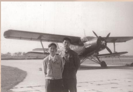
1976年在浙江省金华机场从事1:5万航测与机长合影。