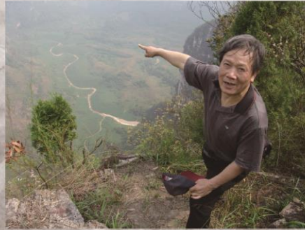
2006年5月打带坨天坑