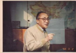
1998年在中国勘查技术院学术交流会上