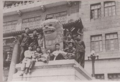
1952年全国高校进行院系调整后，将部分东北工学院和山东大学地质系部分师生加上新生，于1952年建立了东北地质学院，图为学院教学楼外景。