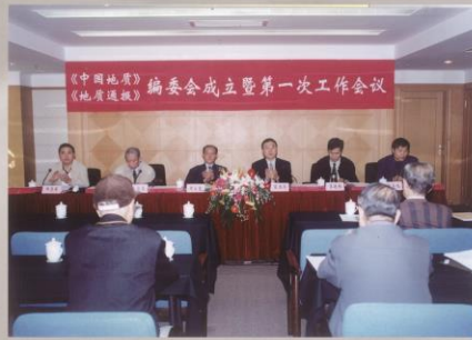
2000年山东青岛《中国地质》《地质通报》编委会成立暨第一次工作会议