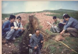
1985年在内蒙古大青山上通过查证化探异常发现金矿。